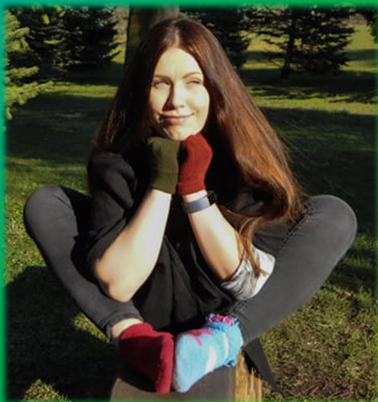
KARIN SOTSIAALMEEDIA GURU