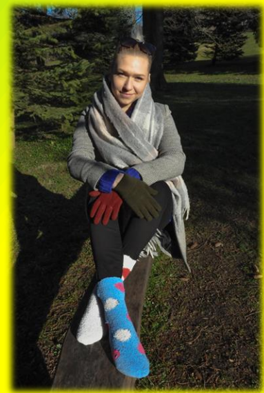
KARMEN MEEDIAGA SUHTLEMINE